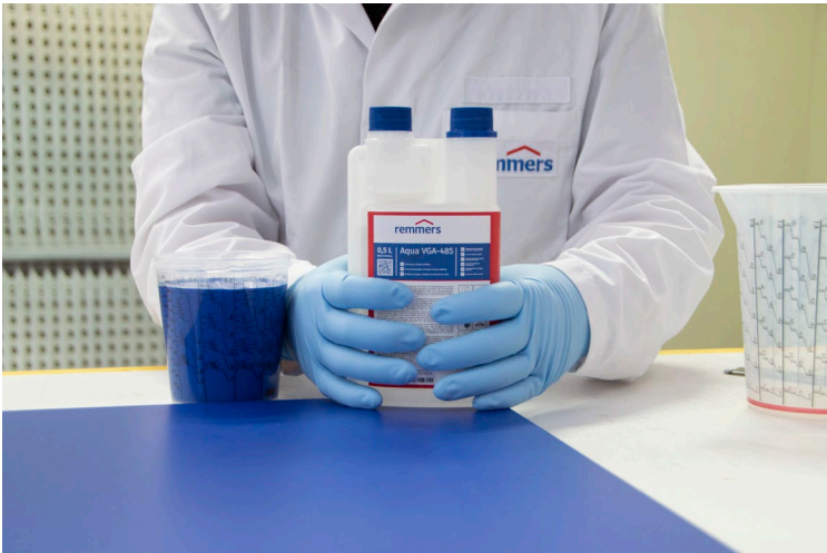
1439 – 1 Aqua VGA-485 Dosiergebinde.jpg

Für die exakte Dosierung von Aqua VGA-485-Vernetzer & Glaslack-Additiv hat Remmers ein spezielles Dosiergebinde konzipiert.